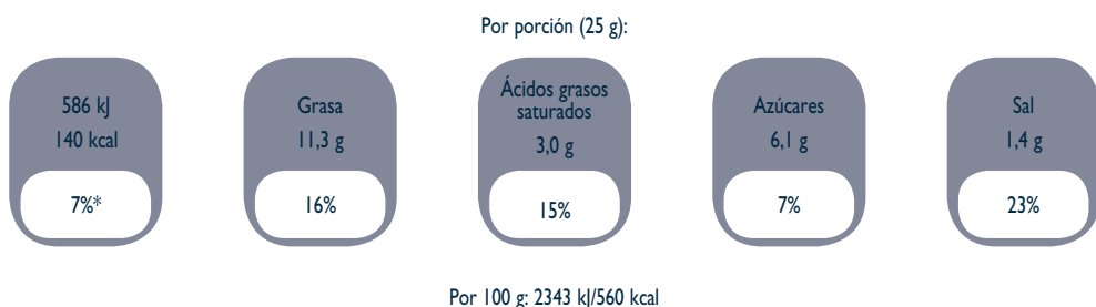
Figura 3. Ingestas de referencia por porción o unidad de consumo

*Ingesta de referencia de un adulto medio (8400 kJ/2000 kcal)