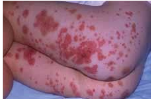
Figura 3. Púrpura