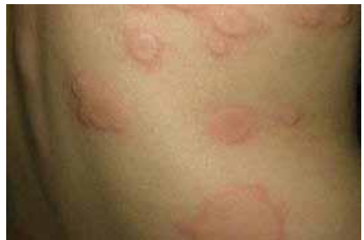
Figura 6. Urticaria