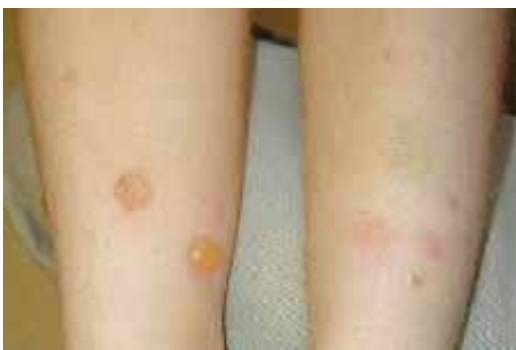
Figura 5. Picaduras de insecto