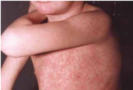
Figura 9. Escarlatina