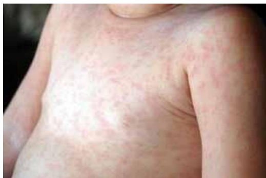
Figura 1. Exantema súbito

En los mismos grupos pequeños, de dos o tres personas, entregaremos una hoja con fotos (en color) de lesiones dermatológicas para que en grupos elijan la imagen o imágenes que les parecen más importantes y motivo para acudir a Urgencias y cuáles no.