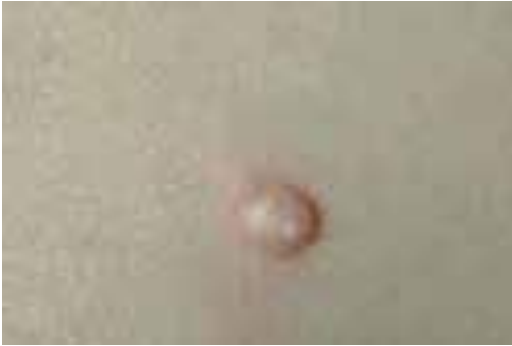
Figura 2. Molusco