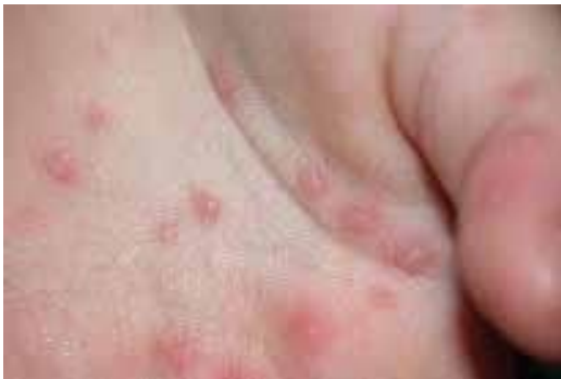
Figura 3. Enfermedad mano-pie-boca