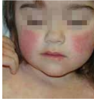
Figura 8. Megaloeritema