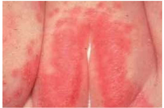
Figura 10. Dermatitis del pañal

A continuación, en un PowerPoint se darán pinceladas sobre cada una de estas enfermedades: su causa y si necesitan o no tratamiento (atlas dermatológico básico).