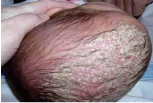
Figura 7. Costra láctea