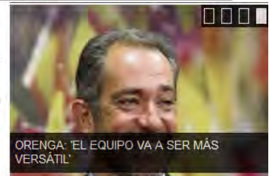
ORENGA: 'EL EQUIPO VA A SER MÁS VERSÁTIL'